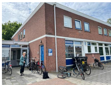
Kastanjelaan 2, Groningen

Deels werken de vrijwilligers (een aantal dagdelen) op ons kantoor, deels doen ze werkzaamheden op afstand. Ze verzorgen onder andere de donateursadministratie, de boekhouding, de correspondenties, de redactie, opmaak en verzending van Steungroepnieuws, enzovoort enzovoort.